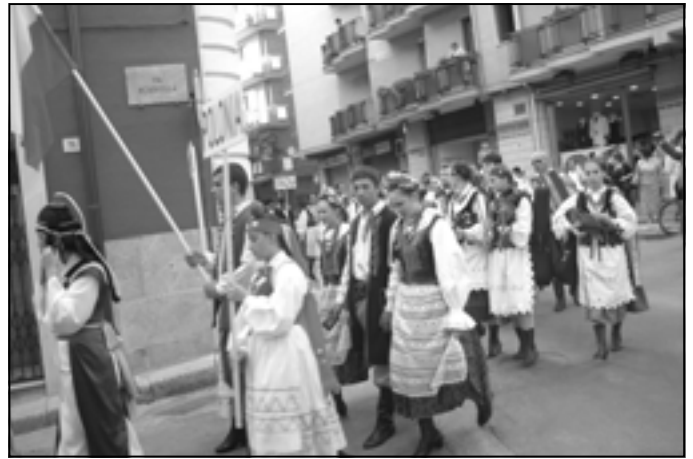
Sfilata ulicami Graviny.