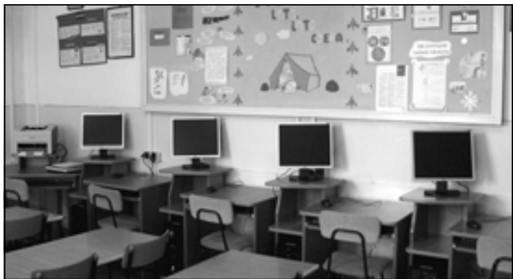
Nowa pracownia komputerowa w Szkole Podstawowej w Górze Ropczyckiej jeszcze pusta, za kilka dni wypełni się uczniami.

W czerwcu 2007 r. Ogólnopolska Fundacja Edukacji Komputerowej dostarczyła