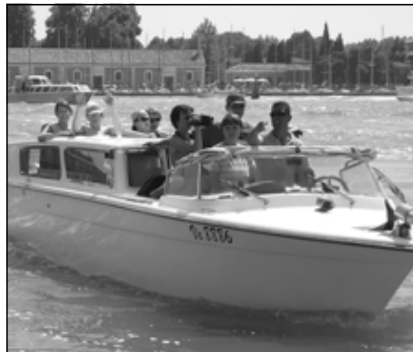
Chwila relaksu na wodzie.