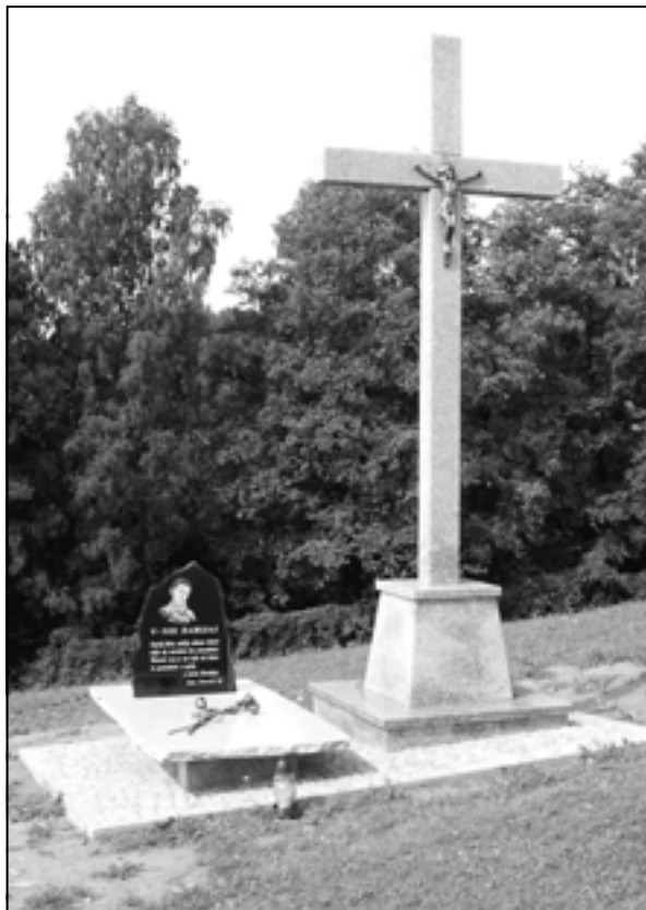
Symboliczny grób dziecka poczętego, ale nie narodzonego stanął na cmentarzu w Zagorzycach Górnych.