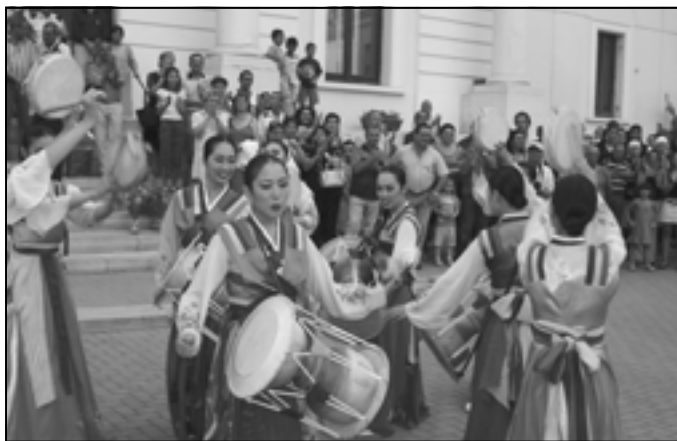
Tańczący zespół z egzotycznej Korei.

Wypoczynek miał miejsce przeważnie podczas sjeisty (po obiedzie), gdyż w nocy rzadko można było przespać więcej niż 3-4 godziny. Nocne zabawy i tańce miały miej-