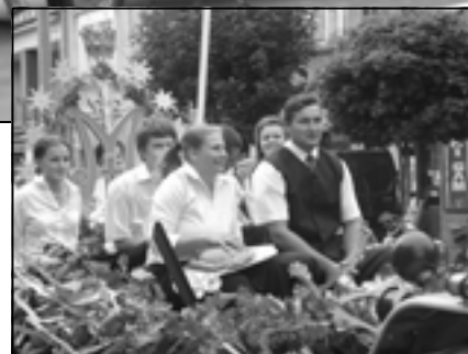
Grupa z Rudy.

lejne grupy, prezentujące wykonane przez siebie wieńce. Najczęściej nawiązywały one do symboliki religijnej, patriotycznej i rolniczej. Były więc krzyże, figury Matki Boskiej i Chrystusa, różaniec, ambona z Ewangelią, serce, imię Maryi w aureoli z gwiazd, wóz ze zbożem, a także sporych rozmiarów makie-