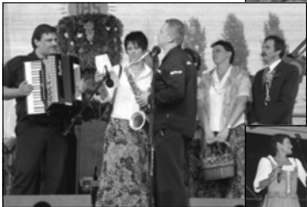
Grupa wieńcowa z Krzywej.

Błogostaw panie Boże naszej całej Ojczyźnie By była tu praca – byśmy nie musieli Tudać się na obczyźnie.