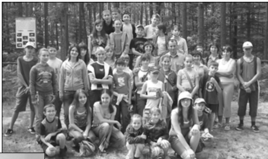
Pamiątkowa fotografia na „Świerczówce”