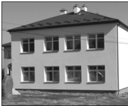
Szkoła w Będziemyślu przeszła kapitalny remont.

Największy remont przeprowadzony został w Szkole Podstawowej w Będziemyślu. Tu m.in wymieniono stropy drewniane na żelbetowe, wykonano nowe instalacje, wymieniono okna, dach, docieplono ściany, wykonano nową elewację. Trwają już końcowe prace, tak by uczniowie mogli rozpocząć naukę w „nowej-starej” szkole.