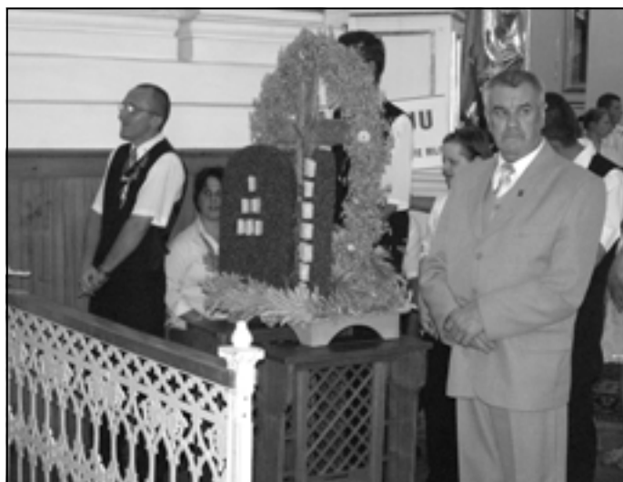
Przedstawiciele PSOUU koło w Sędziszowie Młp.

Na podstawie: Krzysztof Ruszel, Leksykon kultury ludowej w Rzeszowskiem , Rzeszów 2004.