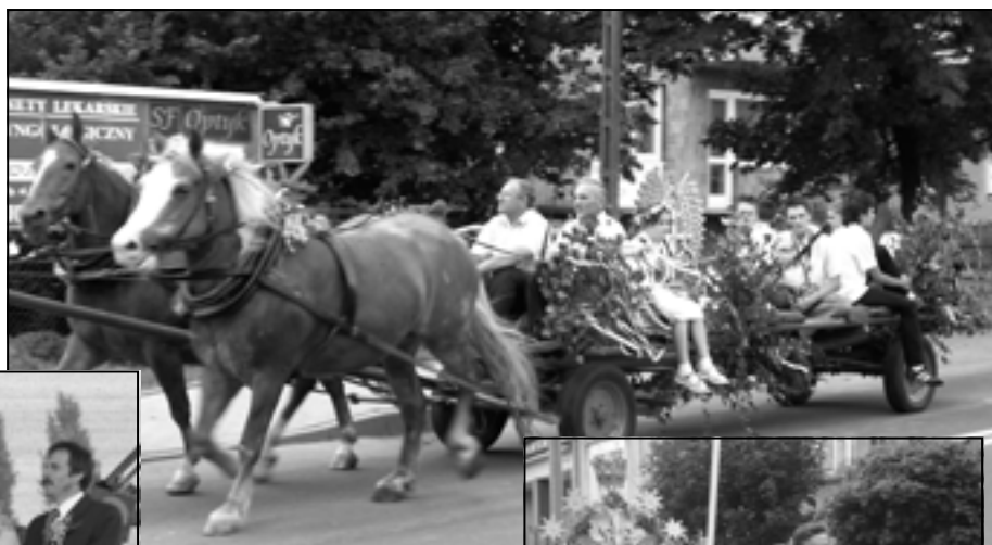
Przejazd do kościoła parafialnego.

By naszą ojczyznę swą pracą wspierali A nie fala uchodźców Dotychczas ludzie starsi mają swoje grosięta Ale za kilka lat będą boso chodzić I w podartych porciętach.