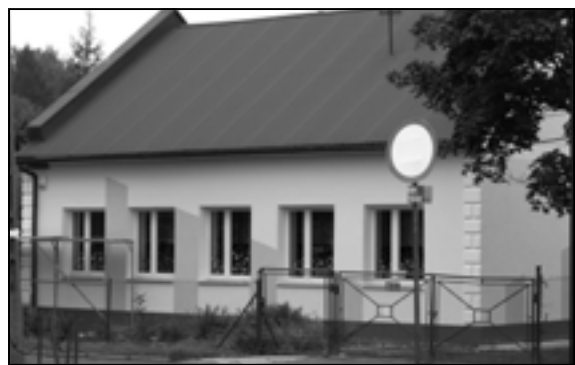
Nowa elewacja Przedszkola nr 1.

Trwa budowa hali przy gimnazjum w Sędziszowie Młp. Termin jej oddania do użytku wyznaczono na koniec października. To bardzo ważna inwestycja, bowiem lekcje wychowania fizycznego w szkole odbywały się dotąd w niezwykle trudnych warunkach.