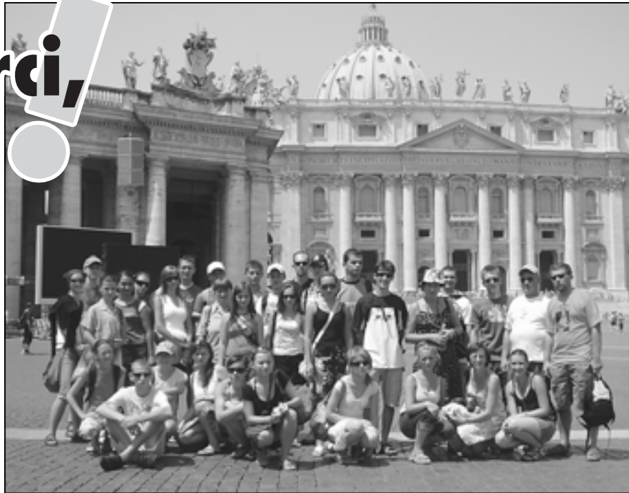
Rochy na Placu św. Piotra.

Pierwszym faktem, który zaskoczył Polaków, były pory podawania posiłków oraz samo menu. Jeśli śniadania i obiady serwowane były w „normalnych” godzinach, to kolacje często wydawano grubo po północy – nawet o trzeciej nad ranem. Do tego dochodziła także niebywała niepunktualność Włochów, która wręcz zadziwiała uczestników festiwalu. Samo jedzenie było bardzo zróżnicowane – zwłaszcza na lunch codziennie podawano inne... rodzaje makaronów. Należy też wspomnieć o włoskiej pizzy, która, mimo świa-