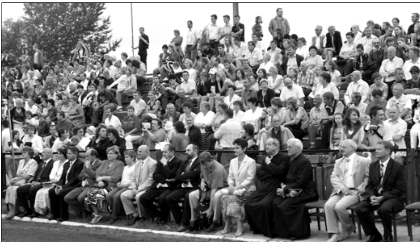
Trybuny sędziszowskiego stadionu szczerze wypełnili widzowie. Na pierwszym planie honorowi goście dożynek.