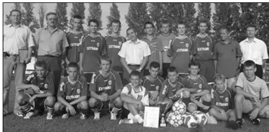
Zwycięska ekipa i jej trenerzy wraz z organizatorami turnieju.