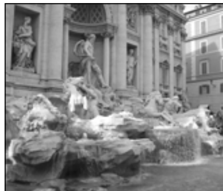
Fontanna di Trevi.

Wieczorem polski autokar zajechał do Rzymu, w którym strudżonym tancerzom przyszło spędzić noc. Wczesna pobudka