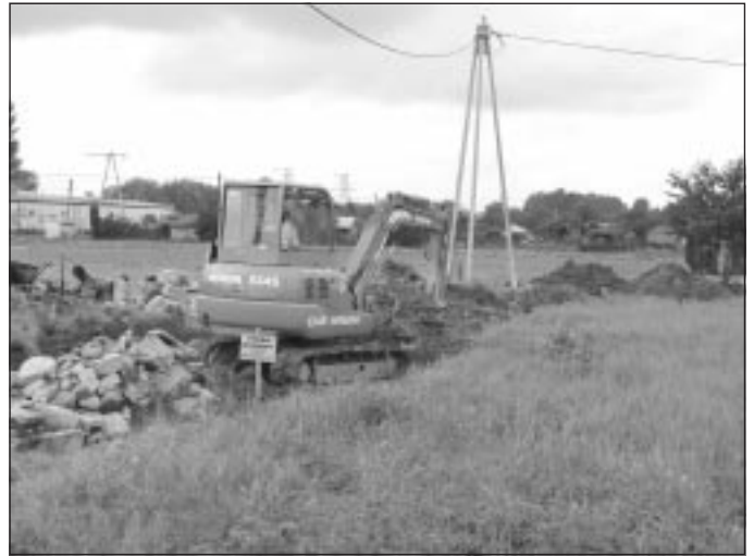
Budowa kanalizacji na osiedlu Rędziny.