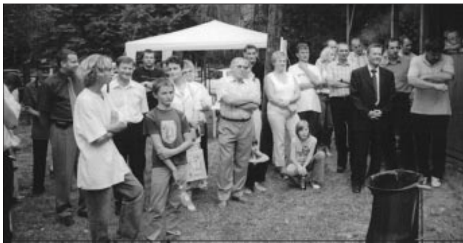
Zaproszeni goście i uczestnicy obchodów.