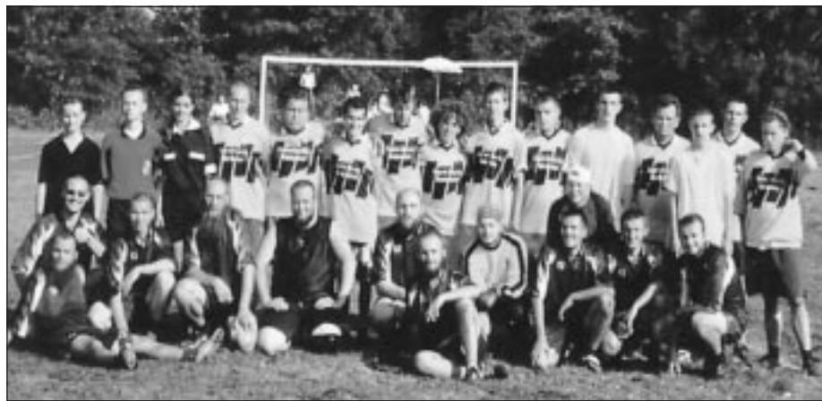
Drużyny piłkarskie Nowicjatu OO Kapucynów i Wolicy Ługowej wraz z sędziami meczu.