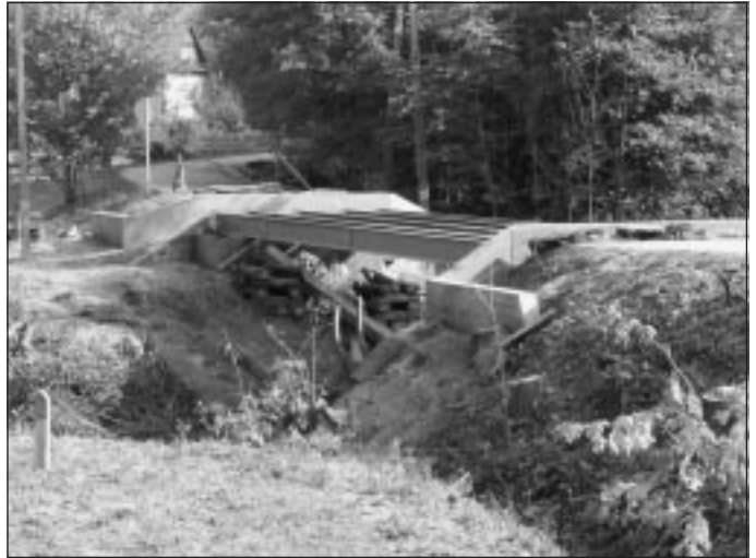
Remont mostu w Zagorzycach Dolnych.