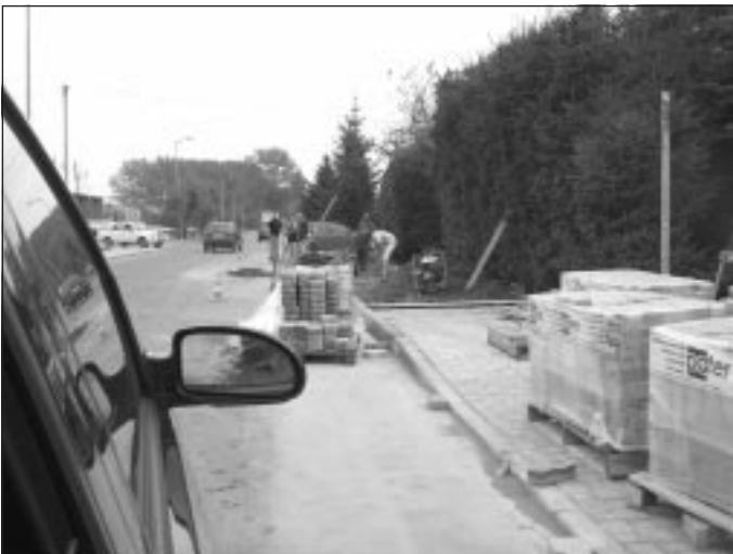
Remont chodnika przy ulicy Armii Krajowej.