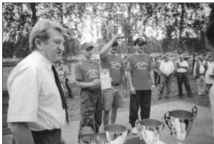
Zwycięska drużyna zawodów.