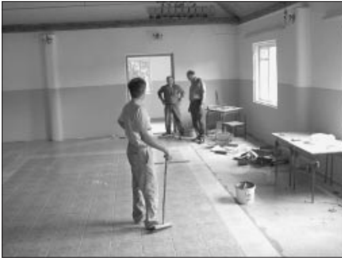
Remont remizy strażackiej w Rudzie.