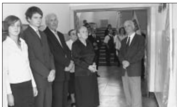
Asysta do odsłonięcia tablicy pamiątkowej w budynku szkoły.