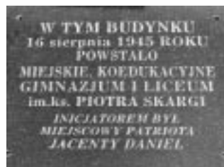
Tablica pamiątkowa na pierwszym budynku szkoły przy ul. ks. Stanisława Maciąga (dawna ul. ks. Pawła Sapeckiego)