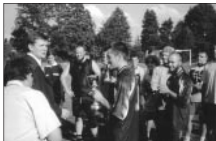
Boiskowe forum dyskusyjne.