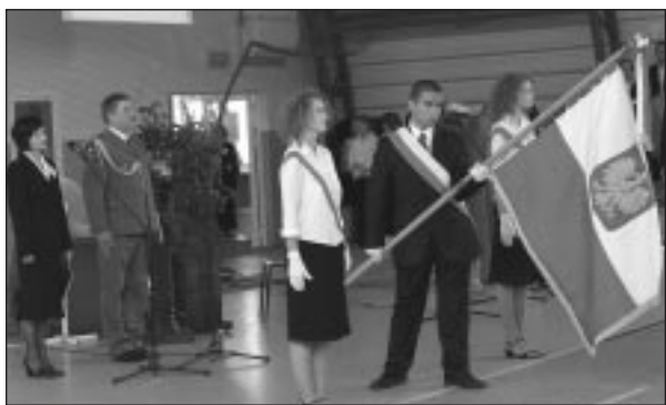
Podczas hymnu państwowego w hali widowiskowo-sportowej.