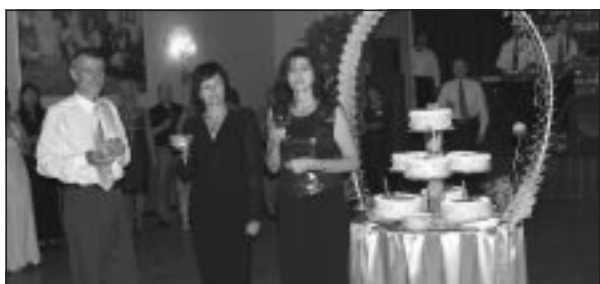
Tort urodzinowy dla „Szacownej Jubilatki”