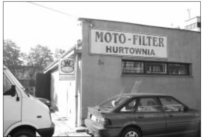
Moto-Filter to przedstawiciel średziszowskiej Wytwórni Filtrów.