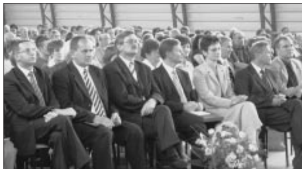
Władze gminne oraz przedstawiciele samorządu powiatowego i wojewódzkiego.