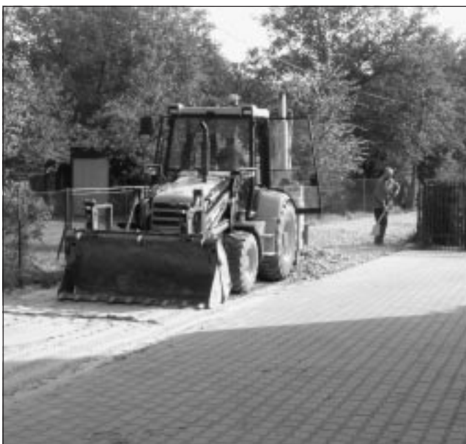
Przebudowa ul. Blich.