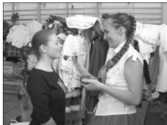
Ostatnie przygotowania do koncertu.

Kiedy postanowił założyć zespół w Sędziszowie, zaprosił mnie do współpracy. Czuję się więc matką – jeżeli nie rodzicielką, to przynajmniej matką chrestną zespołu. Od początku byłam odpowiedzialna za sprawy artystyczne, a spr-