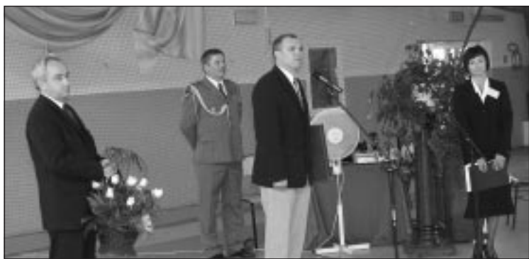
Gratulacje składają Starosta i Przewodniczący Rady Powiatu.