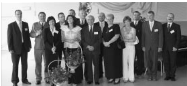
Komitet Organizacyjny Obchodów Jubileuszu Liceum