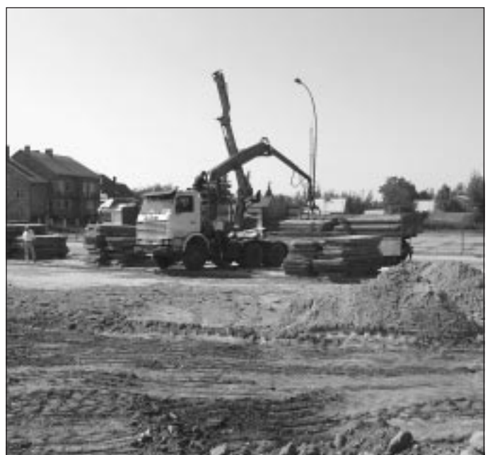
Rozbudowa placu targowego.