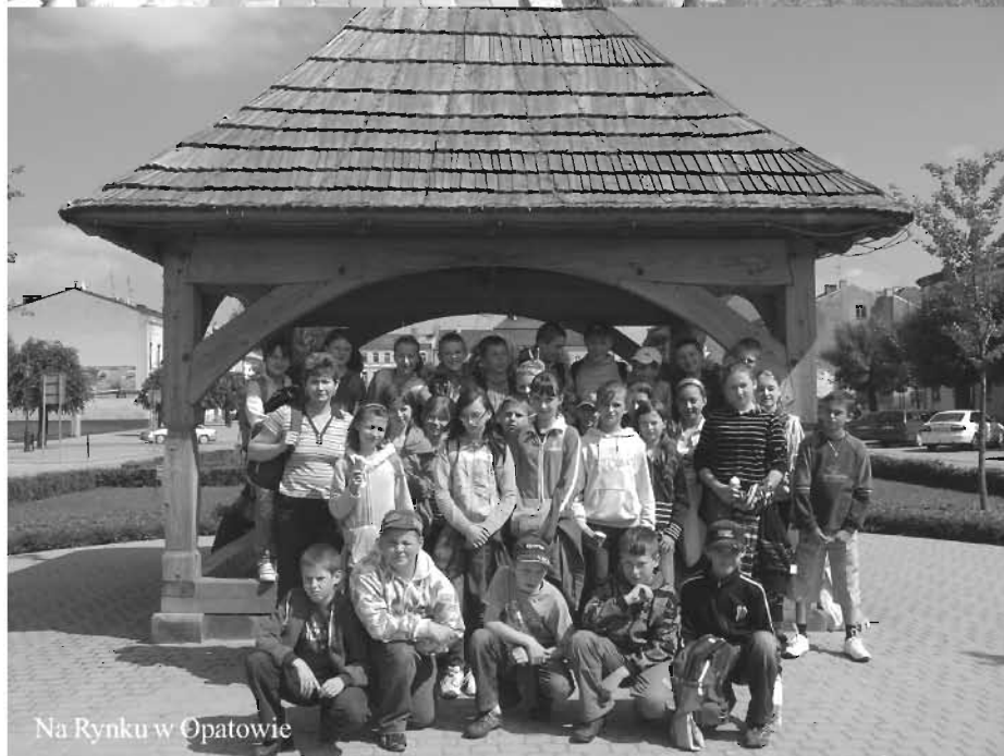
Na Rynku w Opatowie