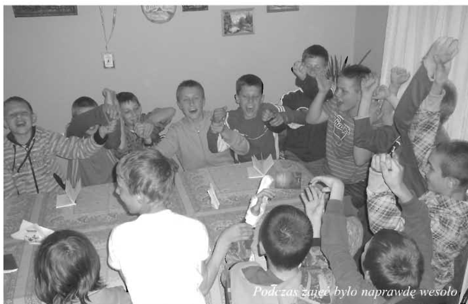
Podczas zajęć było naprawdę wesoło

„Fakty i Realia” w wersji elektronicznej na stronie internetowej: www.zolynia.pl (menu: Aktualności --> Gazeta samorządowa)