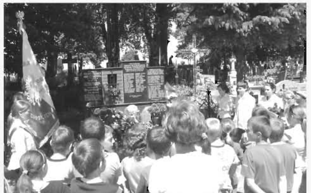
Uczniowie oddają hołd poległym