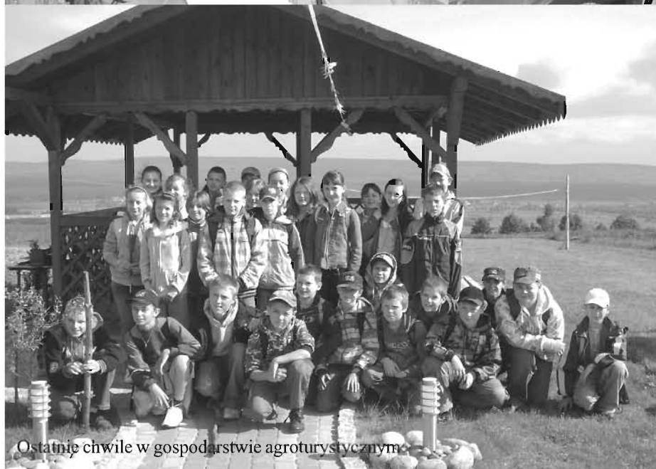
Ostatnie chwile w gospodarstwie agroturystycznym