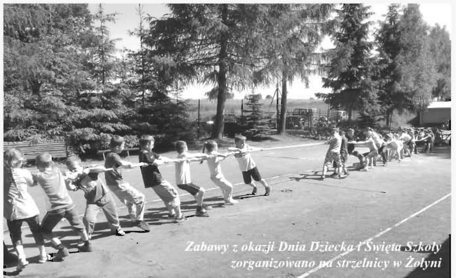
Zabawy z okazji Dnia Dziecka i Święta Szkoły zorganizowano na strzelnicy w Żołyń

Po wrażeniach sportowych i zabawach na wesoło udaliśmy się wszyscy na cmentarz. Tutaj przy pomniku upamiętniającym ofiary II wojny światowej odbyliśmy ważną lekcję patriotyzmu. Złożyliśmy hołd rodakom poległym 4 czerwca 1943 r. w czasie pacyfikacji naszej wsi. Dzień ten wybraliśmy bowiem na święto patrona szkoły tj. Batalionów Chłopskich, chlubnie walczą-