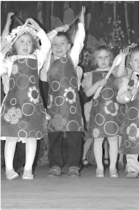
Dzieci z grupy młodszej

Zarysowana w artykule koncepcja współpracy nauczycieli i rodziców ma być w pełnej mierze zachętą do wzmożonych poczynań w trakcie współdziałania przedszkola i domu. Rodzice mogą obserwować możliwości rozwojowe swoich dzieci podczas zajęć dydaktycznych jak i uroczystości przedszkolnych. W tym roku tradycyjne obchody Dnia Mamy w Przedszkolu Oddział ul. Raki połączone zostały ze świętem wszystkich ojców.